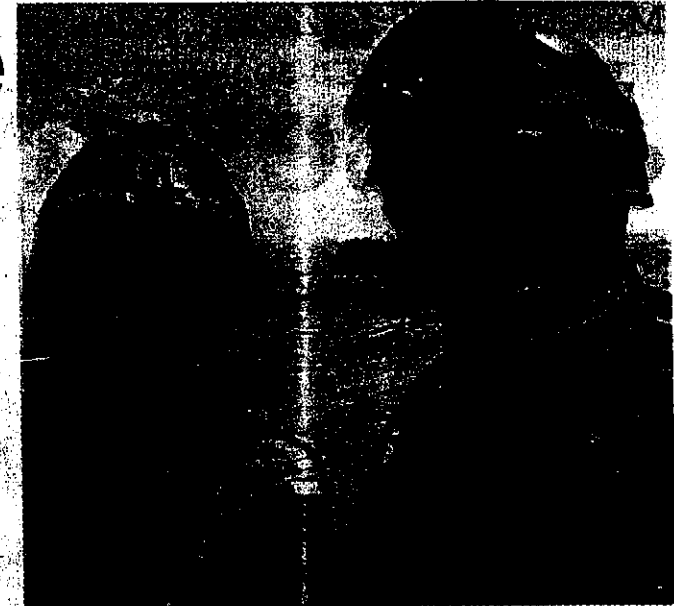
Według ekspertów żołnierze powinni podlegać sądom cywilnym